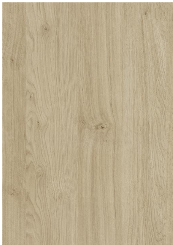
COLOR MELAMINA ROBLE KENDAL