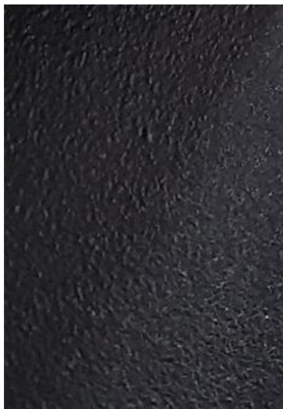
COLOR METAL NEGRO TEXTURADO (ampliación)